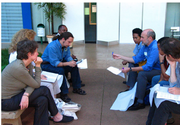
Miembros de la ANA en un taller sobre desarrollo de capacidades en la reunión de la SCB en Brasilia, 2005

En las tres semanas del periodo de respuesta, hemos recibido un total de 80 respuestas, o un poco menos del 10%